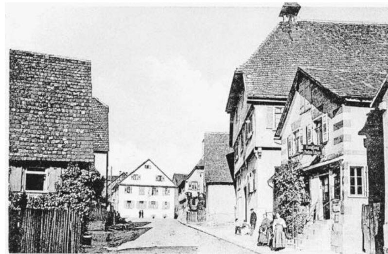
Neckargartach Partie beim Rathaus